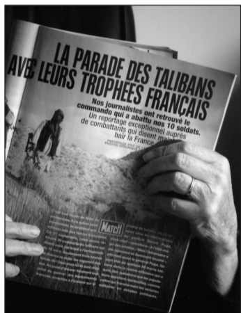
Une sinistre mascarade

l'engagement de nos soldats en est le signe. On les protège de mille façons, ce qui les rend lourdauds au combat et peu apte à se faire aimer des populations, qui est pourtant ce qu'on leur ordonne. Le fait même que cette attitude ne puisse être critiquée sans indécence montre bien, qu'on le veuille ou non, que nous nous mettons hors-jeu. Ce constat, encore inaperçu, se renforce d'un autre qu'on ne saurait, non plus, blâmer : les réactions à la tragédie du 18 août, tant dans l'opinion générale que parmi les proches des victimes, dont certains exigent des comptes, donnent à penser que la mort du soldat, qui était honorable, est désormais scandaleuse, que la cause de ce scandale doit être recherchée et les coupables dénoncés. Les Talibans ont fort bien compris tout cela. Leurs complices, journalistes à Paris Match, ont offert un excellent support pour une sinistre mascarade : « La mort, la voilà, nous la recherchons, vous ne la supportez pas et nous vous tuerons tous ! ».