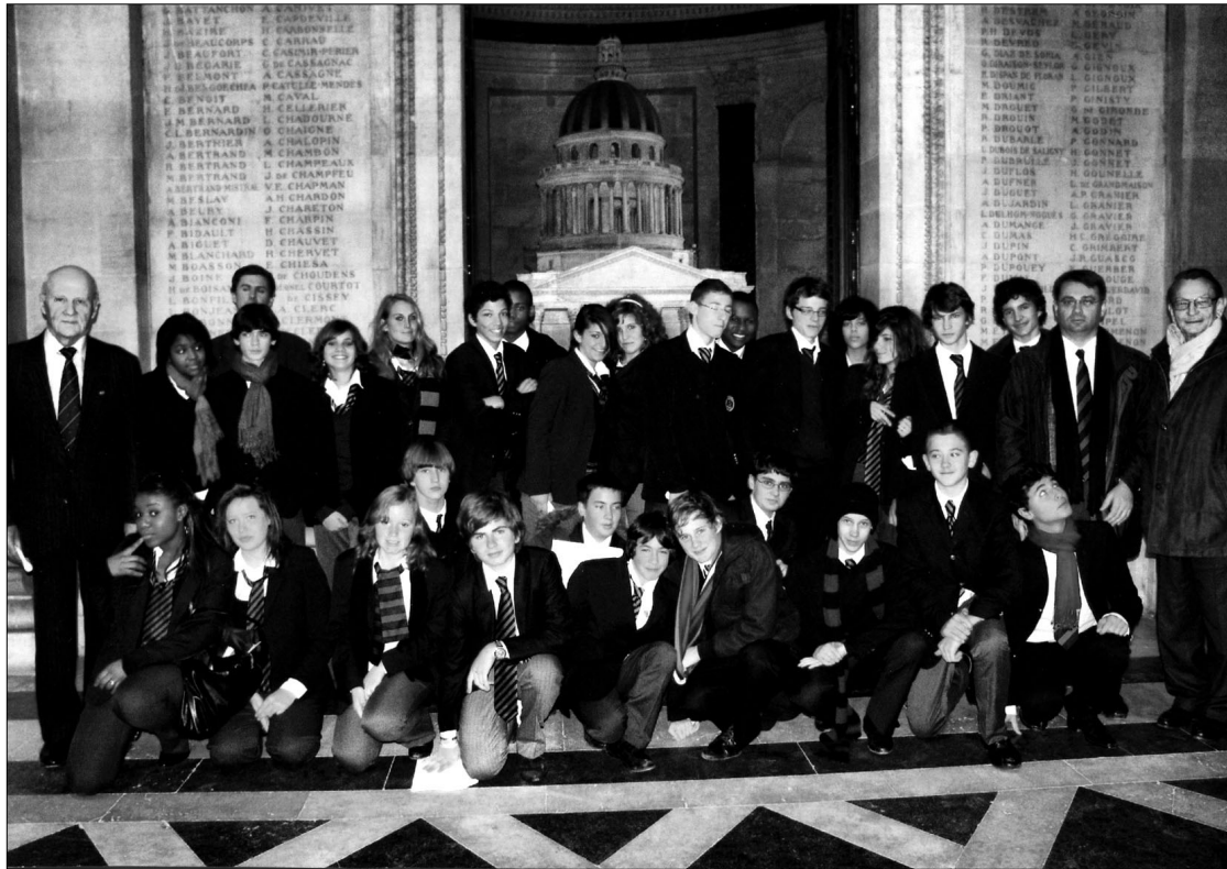
Les élèves de 3 e de Saint-Martin de France au Panthéon

Nous ne pouvons pas ici entrer dans les détails, mais nous pouvons remarquer que jusqu'au début du 20 e siècle, le latin est resté longtemps la langue d'enseignement de bien des universités notamment dans les pays d'Europe de l'Est, en particulier en Roumanie et en Hongrie. D'autre part, langue de l'Église, il demeurait bien vivant au Vatican, et le clergé, en dépit de certains modes d'enseignement, savait encore, au moins dans son élite, l'utiliser. Et même dans certaines familles d'agriculteurs du Pas-de-Calais, on faisait encore des concours de