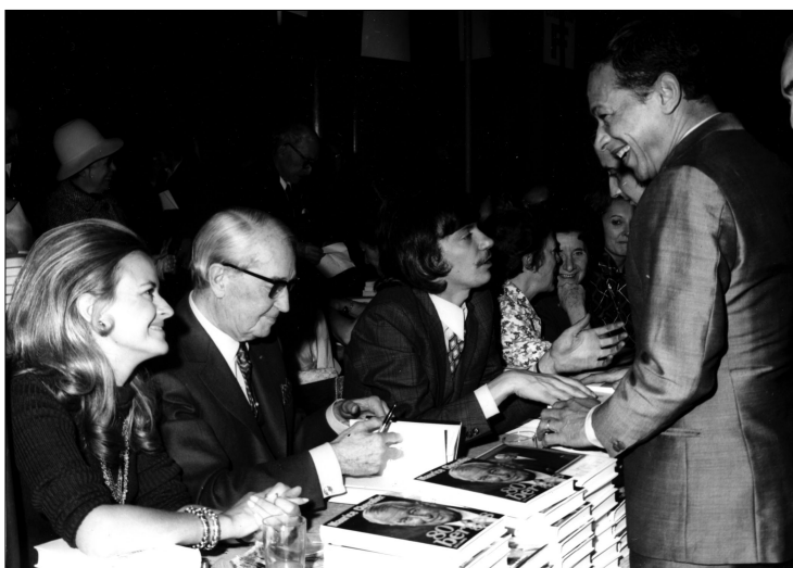
Salon du Livre 1967 Maurice Chevalier et Henri Salvador

Naturellement, parmi plus de mille écrivains, très peu ont laissé un nom, mais il n'est de domaine de la vie intellectuelle ou artistique, militaire, politique ou religieuse française dont les principales personnalités n'aient adhéré à notre association. Ceux qui écrivent avec sincérité savent que la récompense de leurs travaux ne réside pas d'abord dans leur notoriété, mais dans le plaisir d'écrire et la satisfaction de savoir que leurs travaux pourront, s'ils sont bien conservés, servir à leurs successeurs. Ainsi contribuent-ils au maintien des valeurs pour lesquelles beaucoup d'écrivains de toutes opinions ont fait le sacrifice de leurs espérances et que nous voulons,