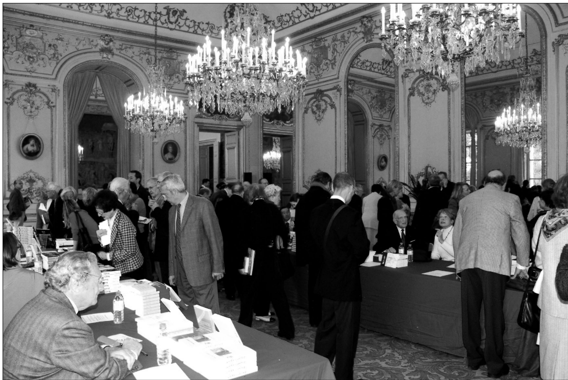
Affluence des grands jours dans les Salons de Boffrand au Sénat