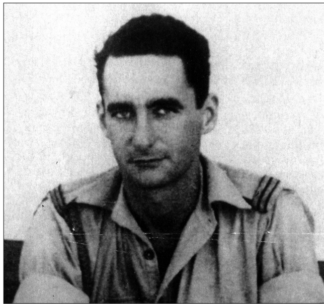
Pierre Messmer en 1940

Mais avec Pierre Messmer, il ne peut être question de retraite. La politique en fait une éminence grise, un auteur que récompensera le moment venu l'A.E.C., le président de la Fondation Charles