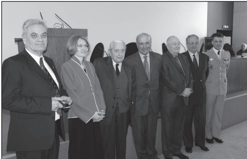
Les lauréats des Prix 2008