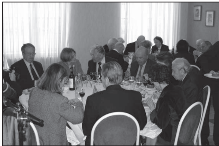
Après les travaux de l'Assemblée Générale, le déjeuner.

L'examen de nos comptes a été jugé "ne pas avoir d'élément remettant en cause la cohérence et la vraisemblance de ceux-ci" par le commissaire aux comptes.