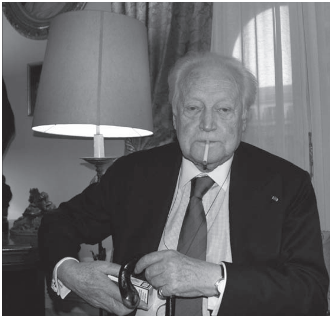
Monsieur Druon : un esprit libre, indépendant et engagé au service de la France.

du commun déchaînant les passions de tous les serviteurs du politiquement correct qu'il balayait d'un revers de phrase assassine.