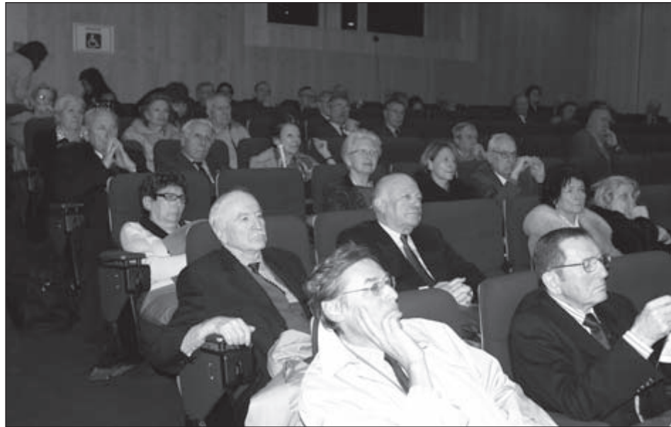
Une vue de l'assemblée

que pour demeurer fidèles à la tradition. Une centaine d'écrivains occupaient les gradins de l'amphithéâtre mis à la disposition de l'association par les autorités militaires, ce dont nous leur sommes très reconnaissants.